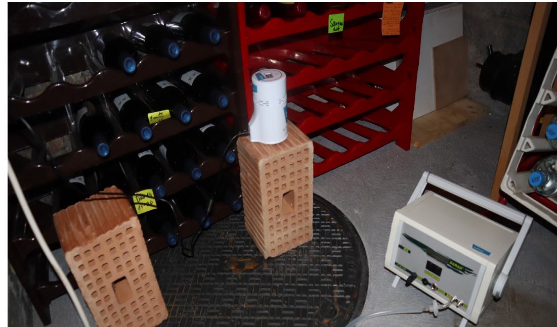
Seminar 204211 23.03.2020 Wildegg

Zielgruppen: Baukader, Bauleitung, Planung, Verwaltung