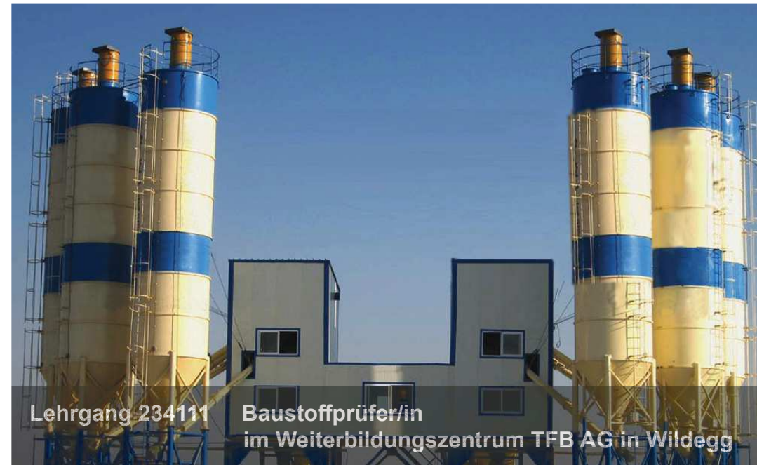
Lehrgang 234111 Baustoffprüfer/in im Weiterbildungszentrum TFB AG in Wildegg

Vom 11. November 2022 bis 07. April 2023