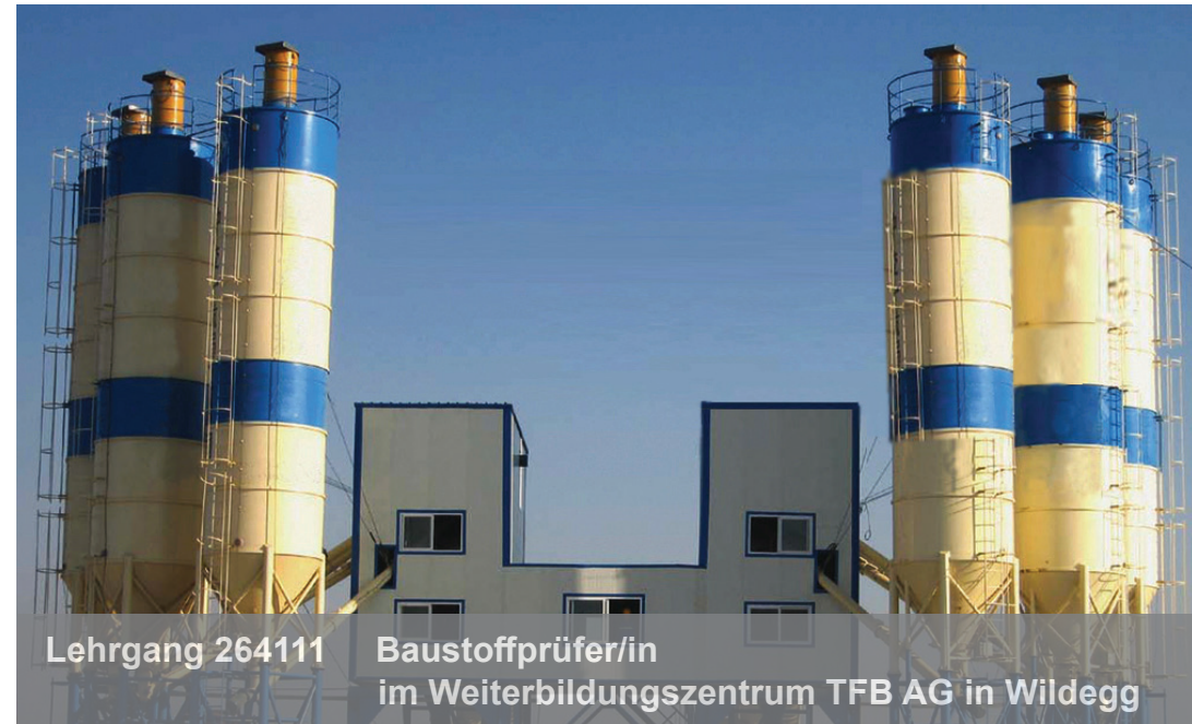
Lehrgang 264111 Baustoffprüfer/in im Weiterbildungszentrum TFB AG in Wildegg

Vom 14. November 2025 bis 17. April 2026